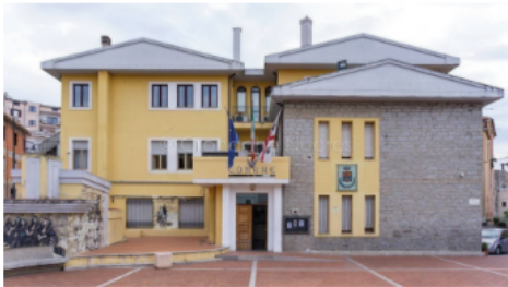
Il Comune di Oliena